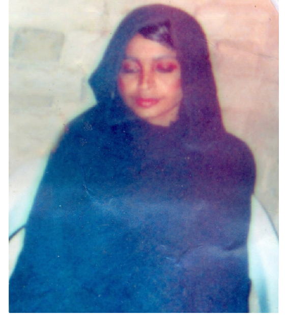
سیریل نمبر 1