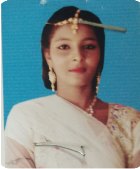
سیریل نمبر 4