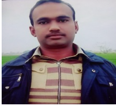
سیریل نمبر 2