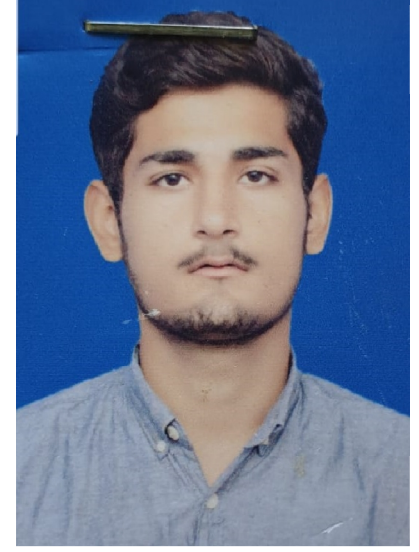
سیریل نمبر 1