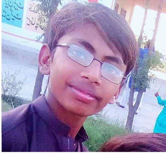
سیریل نمبر 13