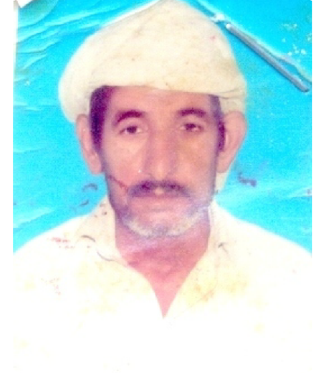
سیریل نمبر 4