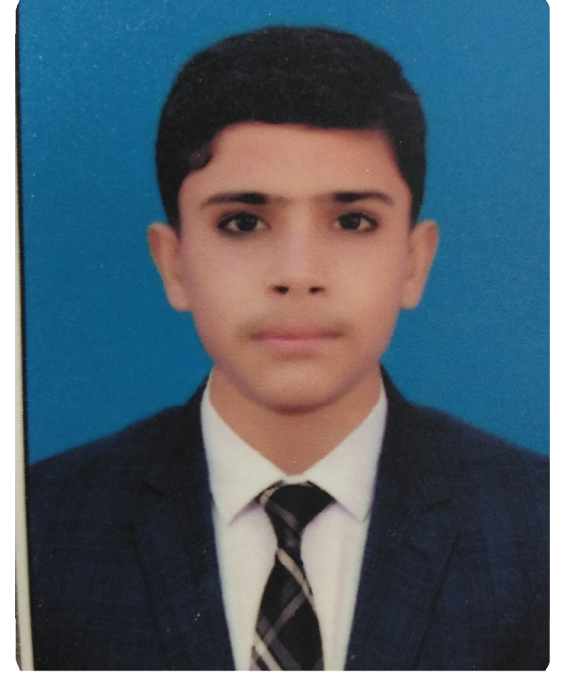
سیریل نمبر 5