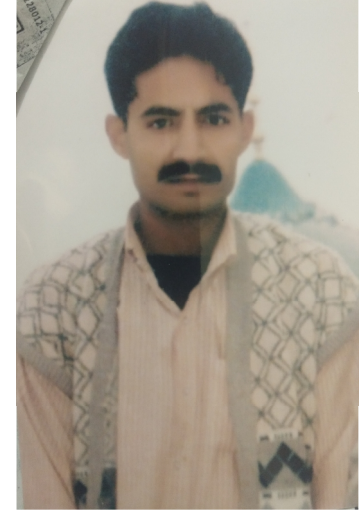
سیریل نمبر 11