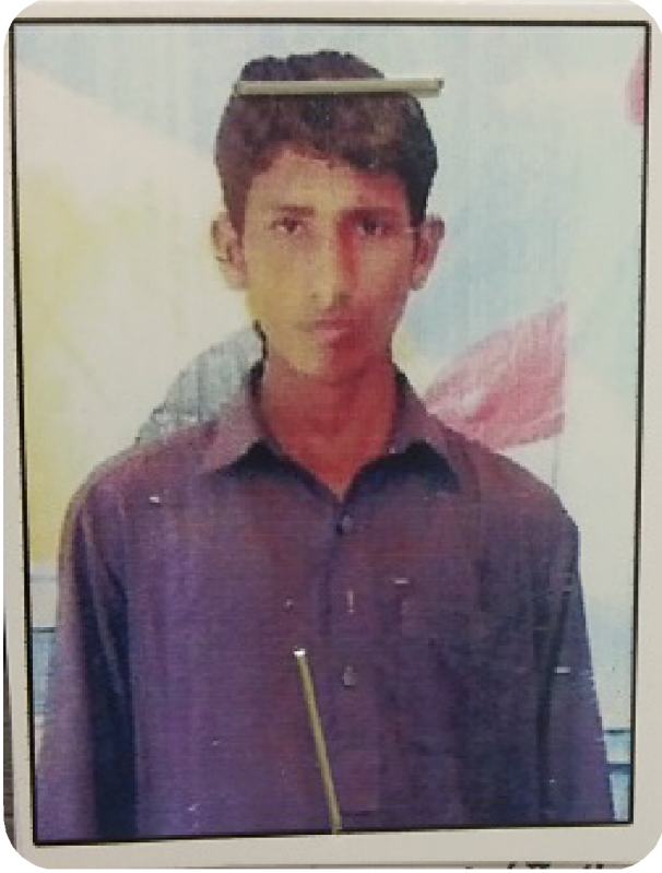
سیریل نمبر 10