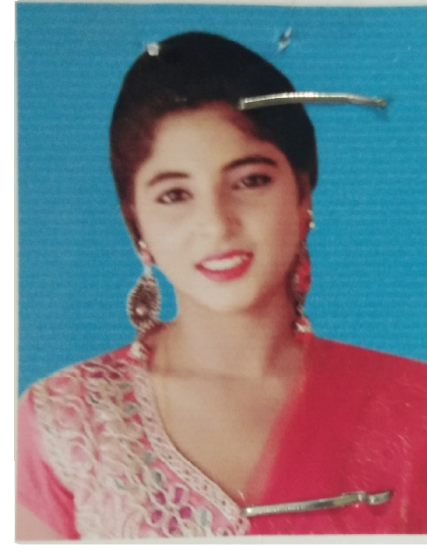
سیریل نمبر 4