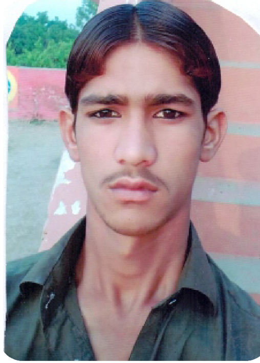
سیریل نمبر 2