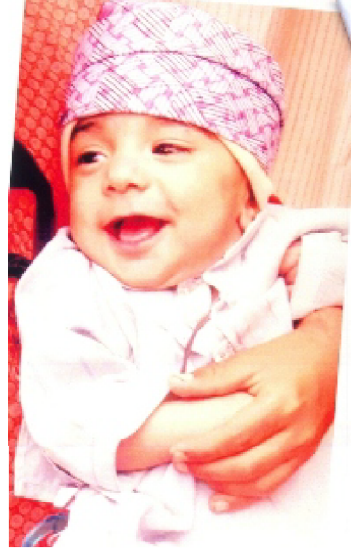
سیریل نمبر 5