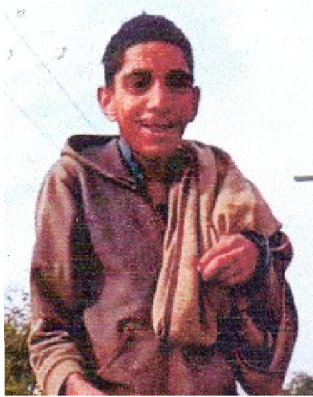
سیریل نمبر 1