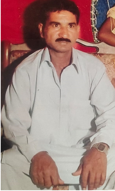
سیریل نمبر 7