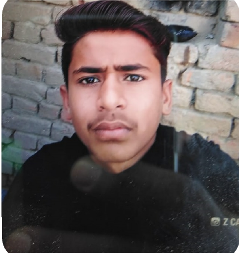
سیریل نمبر 3