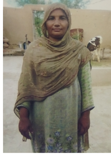
سیریل نمبر 12