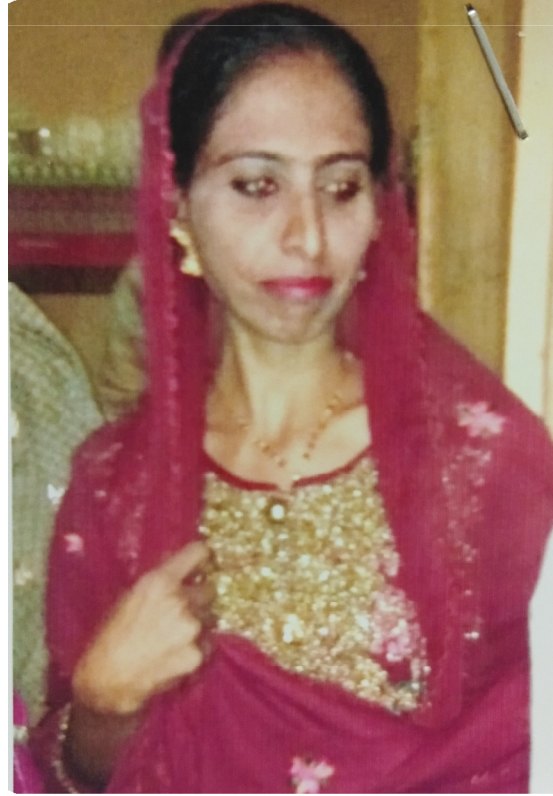
سیریل نمبر 9