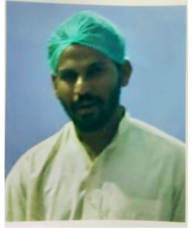
سیریل نمبر 8