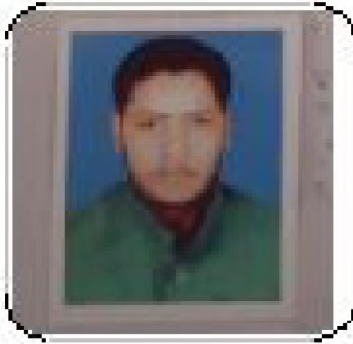
سیریل نمبر 1